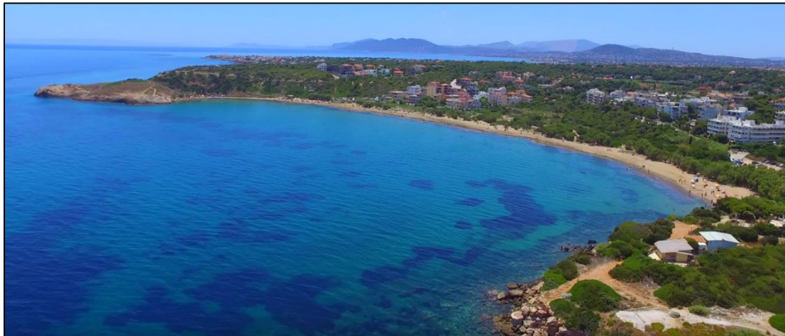
Η παραλία Μαρίκες στο αστικό τοπίο της Ραφήνας